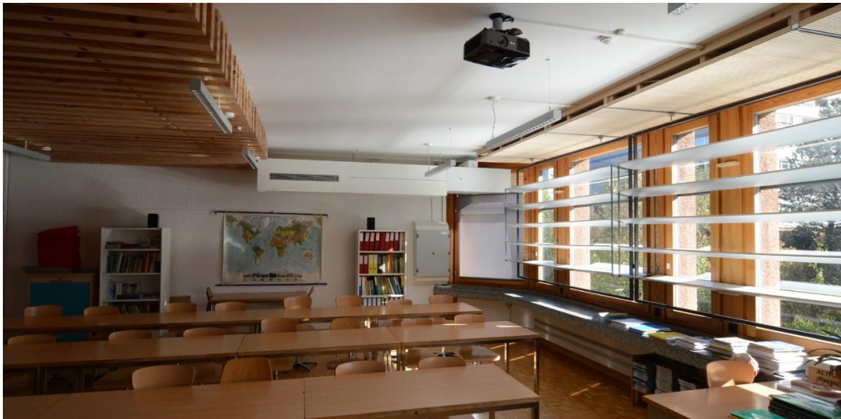
Abbildung 2: Dezentrales Lüftungssystem in der Musterklasse Giacometti